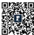
商学院微信公众号