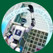
人工智能与 机器人共创中心